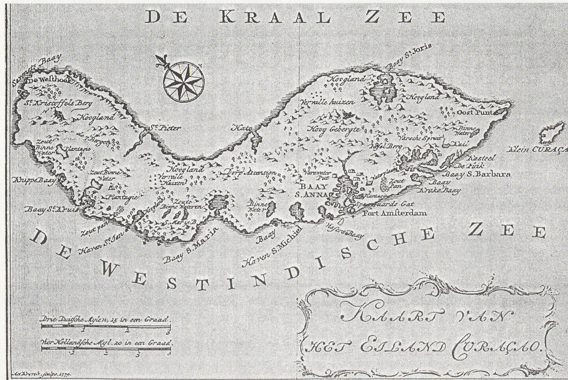
Karte der Insel Curaçao im 18. Jahrhundert. Hier unterdrückte Isaak Faesch einen Sklavenaufstand im Jahr 1750. Alter Stich.